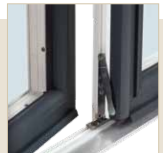
Détail verrou semi fixe de série sur porte fenêtre