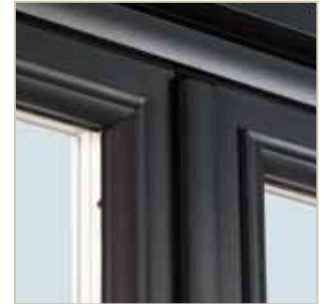
Détail meneau central côté extérieur