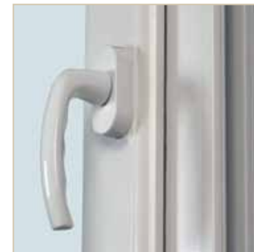
Détail poignée de série : Sécustik