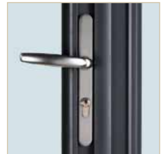
Détail porte fenêtre à serrure