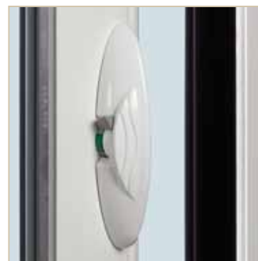
Détail poignée : Calipso