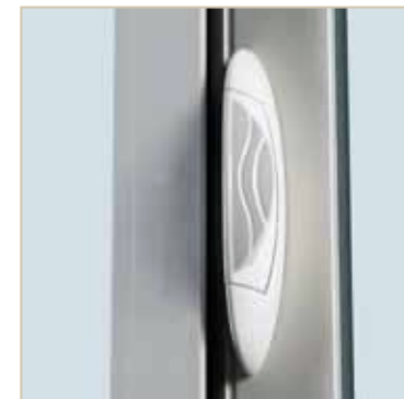
Détail poignée : Neptune