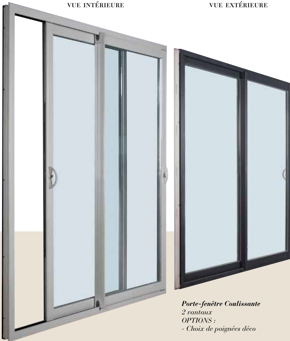
Porte-fenêtre Coulissante 2 vantaux OPTIONS : - Choix de poignées déco