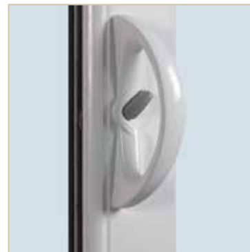
Détail poignée : Cassiopée