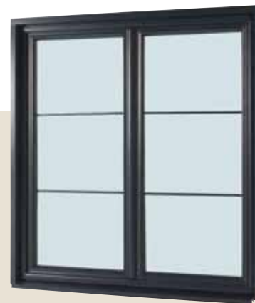
VUE EXTÉRIEURE OPTIONS - Oscillo-battant - Petit bois intégré