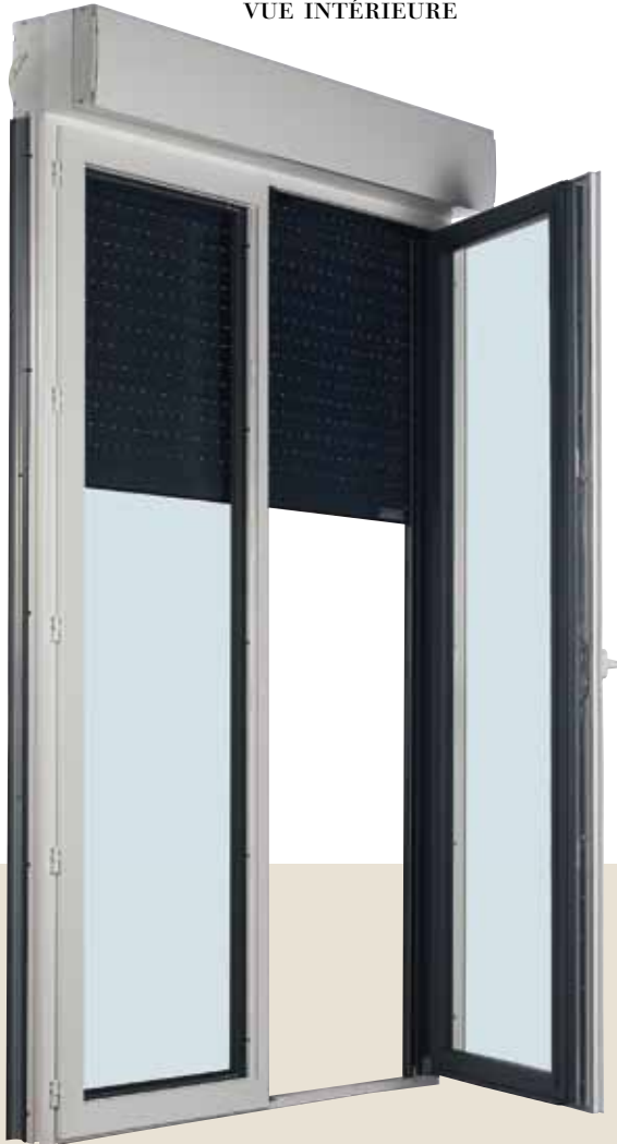
Porte-fenêtre présentée avec volet roulant 2 vantaux Poignée Sécustik de série Différentes options : nous consulter