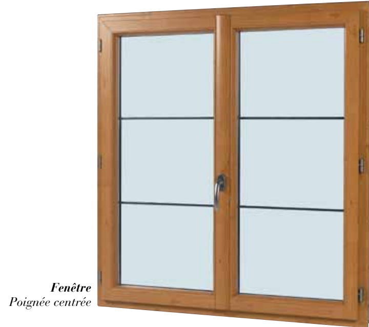
Fenêtre Poignée centrée